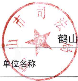
鹤山市司法局 2020 年度行政征用实施情况统计表