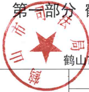
鹤山市司法局 2020 年度行政许可实施情况统计表