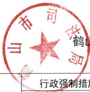
鹤山市司法局 2020 年度行政强制实施情况统计表