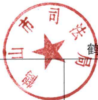
鹤山市司法局 2020 年度行政处罚实施情况统计表