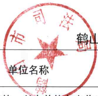
鹤山市司法局 2020 年度行政检查实施情况统计表